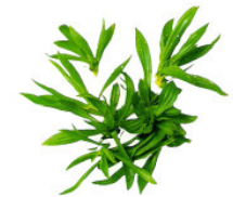
Kräutersalz aus der Toskana